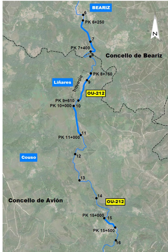
Treitos da actuación da 1ª fase