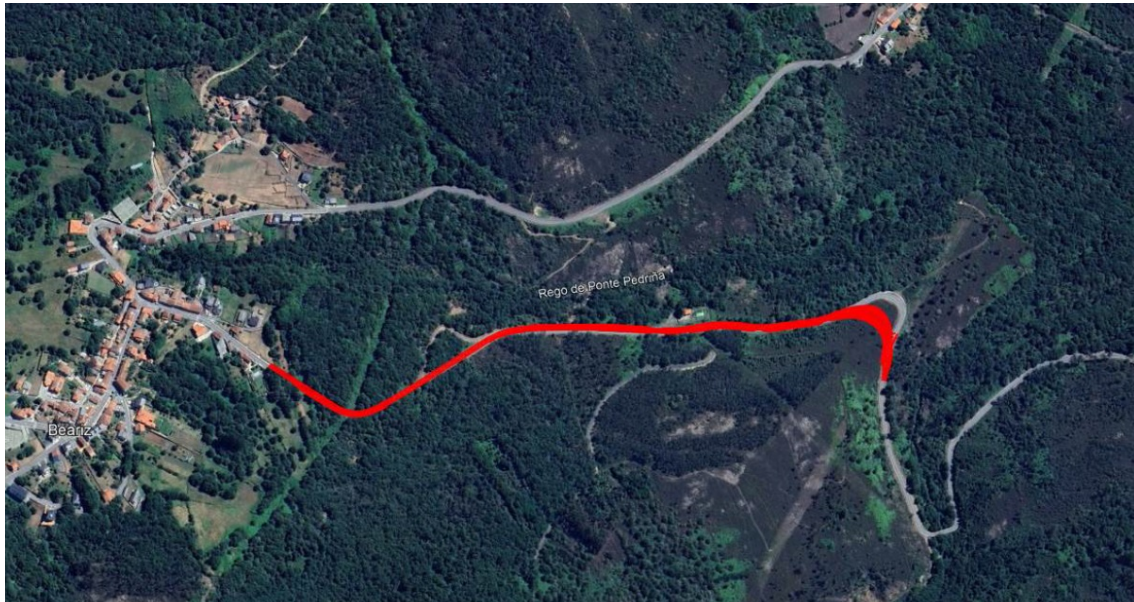
Treito de actuación en Beariz con rectificación da curva do quilómetro 7+350