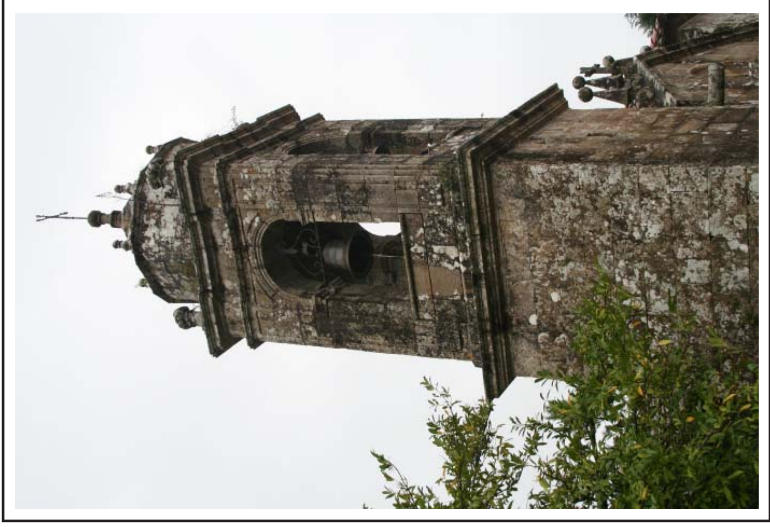
Torre da igrexa de Bastabales, no concello de Brión (A Coruña)

Solo media me deixaron os que de aló me trouxeron os que de aló me roubaron.