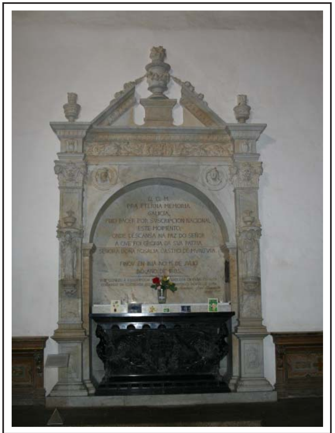
Mausoleo de Rosalía de Castro no Panteón de Galegos Ilustres, en Santiago.

Finalmente, en 1988, foi enterrado o xeógrafo Domingo Fontán.