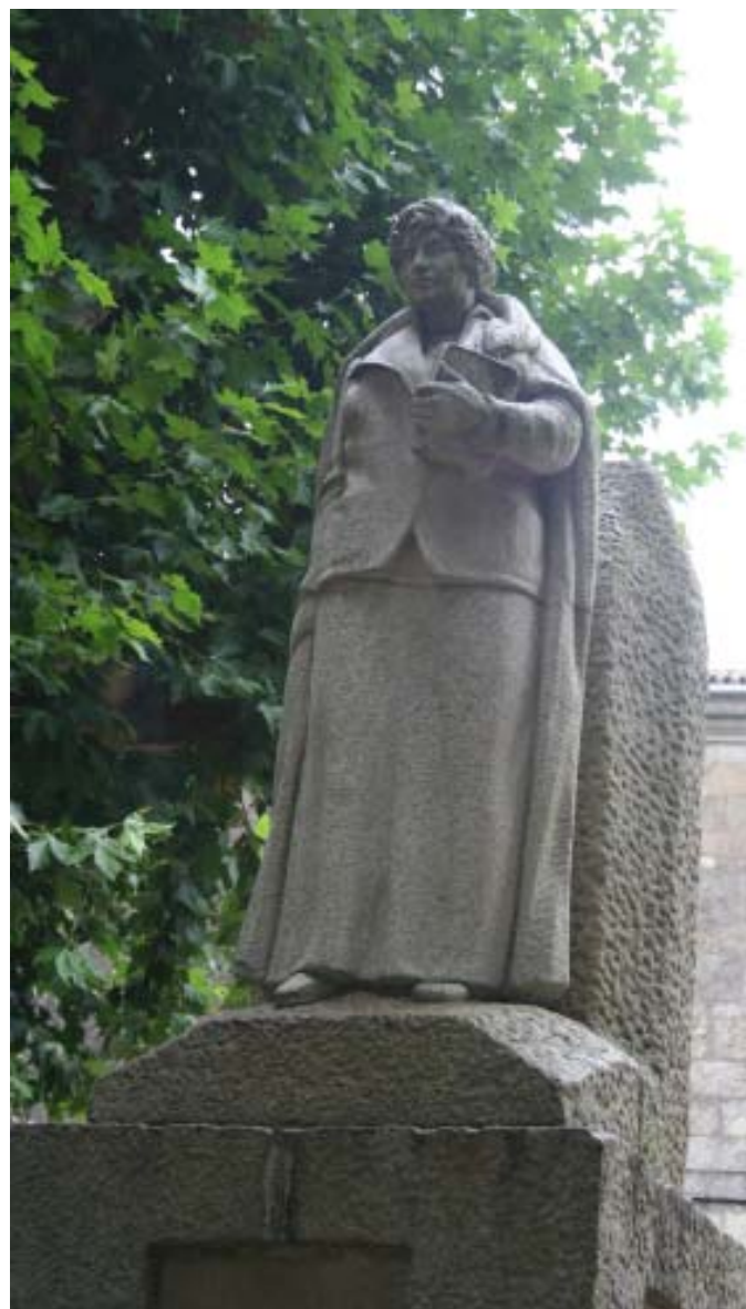
Monumento a Rosalía de Castro no Paseo do Espolón, en Padrón (A Coruña)

Un 15 de xullo de 1885, hai 125 anos, falece Rosalía na súa casa de Padrón e é enterrada, baixo unha oliveira, no cemiterio padroñés de Adina, aínda que os seus restos son trasladados, seis anos despois, ao Panteón de Galegos Ilustres, no convento compostelán de San Domingos de Bonaval.