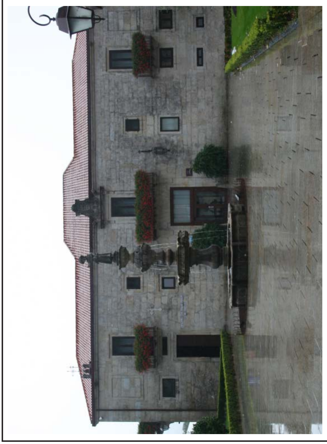
Pazo de Lestrove, en Padrón (A Coruña)