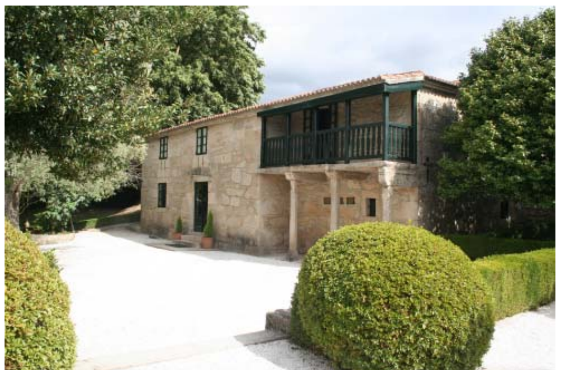
Casa da Matanza, en Padrón, onde Rosalía viviu os seus últimos anos.