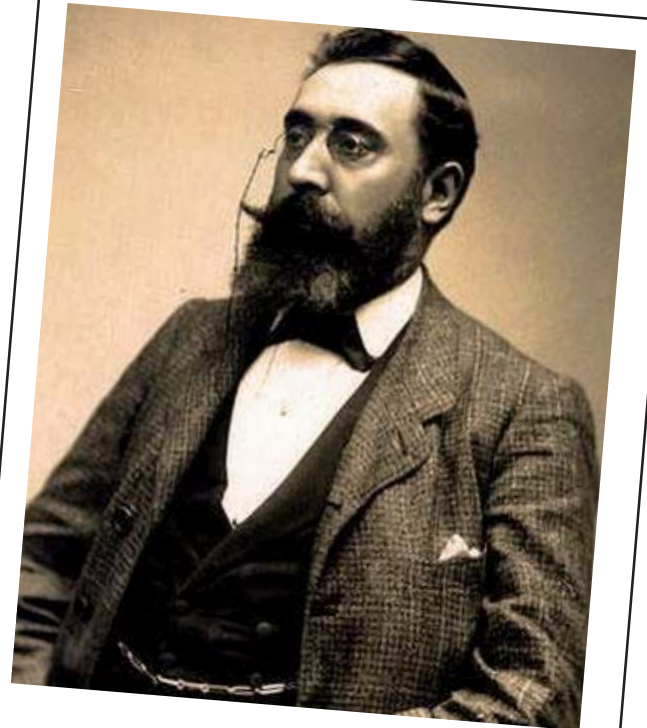
Manuel Curros Enríquez

Nestes anos aparece un xornal escrito en lingua galega, « O Tío Marcos da Portela », editado por Lamas Carvajal e que tivo un enorme éxito e que propiciou a aparición doutros xornais: « A Monteira », en Lugo, « As Burgas », en Ourense e « O Galiciano », en Pontevedra.