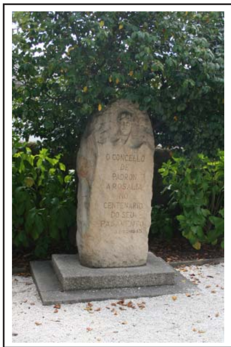
Monolito adicado a Rosalía polo concello de Padrón no centenario do seu pasamento. Casa da Matanza, en Padrón.

Cando Rosalía xa tiña doce anos a súa nai faise cargo dela e lévaa a vivir a Padrón e, posteriormente, a Santiago de Compostela.