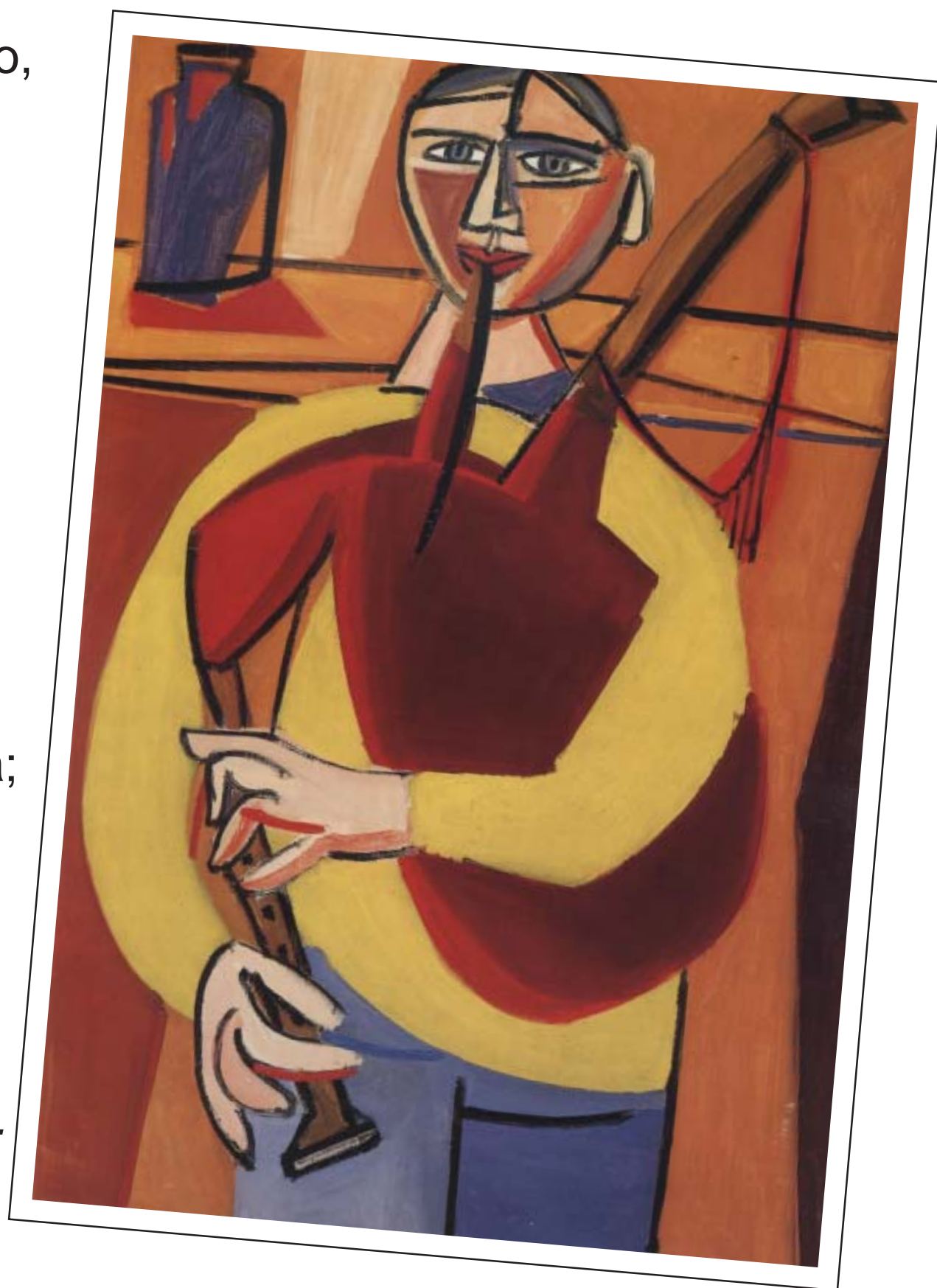
O Gaiteiro, óleo de Luís Seoane